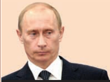
Владимир Путин, председатель правительства России в поздравлении Росфинмониторинга в связи с десятилетием создания ведомства